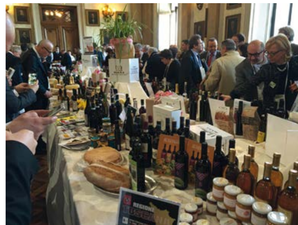
Uno scorcio del convivio che è seguito al Congresso, alimenti tutti provenienti dagli Istituti Agrari italiani.

Nella giornata precedente, presso l'ITIS "G. Galilei" di Roma, l'Assemblea degli istituti aderenti alla rete, alla presenza dei Dirigenti scolastici, Docenti e DSGA ( Direttori Servizi Generali Amministrativi ), si era riunita per confrontarsi sulle problematiche specifiche dei singoli istituti. Questo incontro si è rivelato particolarmente utile, a fine giornata è stato stilato un documento comune, una sorta di relazione sullo stato dell'istruzione agraria e delle sue esigenze che sarà recapitato direttamente al Ministro della Pubblica Istruzione, Stefania Giannini .