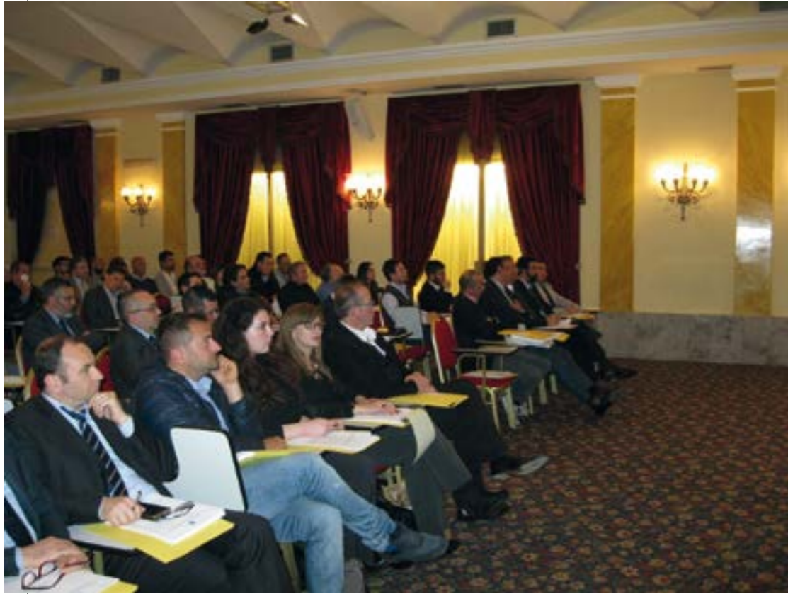
Un'altra immagine della "Sala Risorgimento".

Europea dei Diritti dell'Uomo, possibile in quanto, dopo la sentenza n. 154/2015 della Corte Costituzionale, i gradi di giurisdizione interna sono terminati.