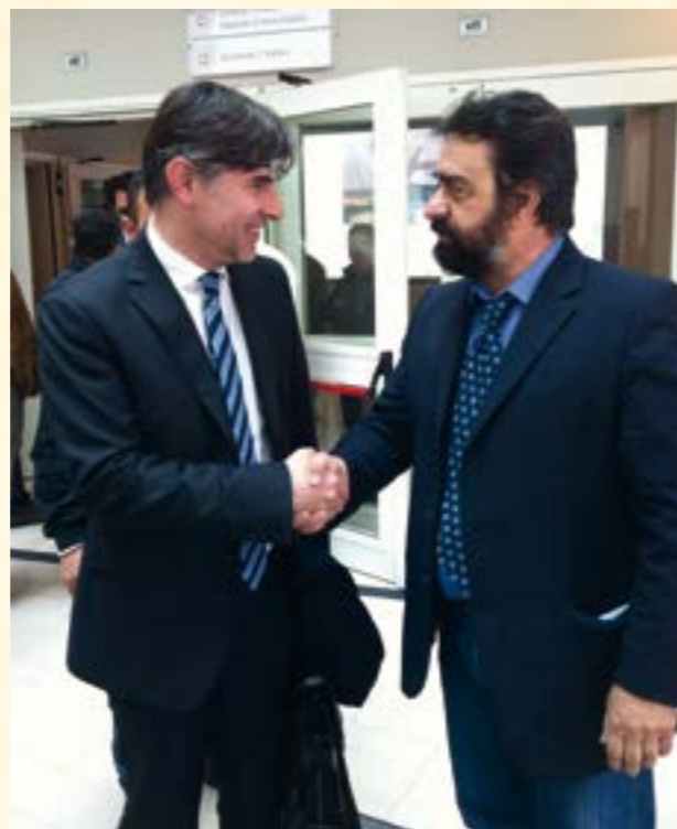
Il presidente del Collegio di Foggia incontra il Viceministro Olivero

La riunione è servita ad analizzare le problematiche che attanagliano il mondo dell'agricoltura, ma anche ad analizzare le opportunità in arrivo con il nuovo PSR ( per la sola Puglia sono previsti 1,6 miliardi di euro ), temi centrali sono stati lo sviluppo locale, il trasferimento delle conoscenze, l'associazionismo, la cooperazione, le foreste e l'ambiente.