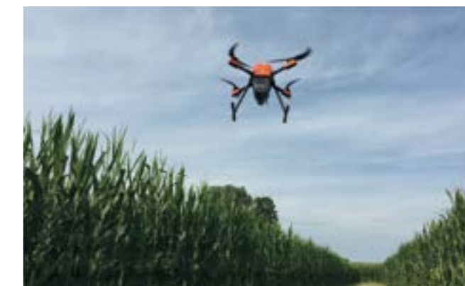
Drone in volo

MS - Per quanto riguarda il drone, pensiamo di essere pronti, per il prossimo anno, per i trattamenti contro il ra-