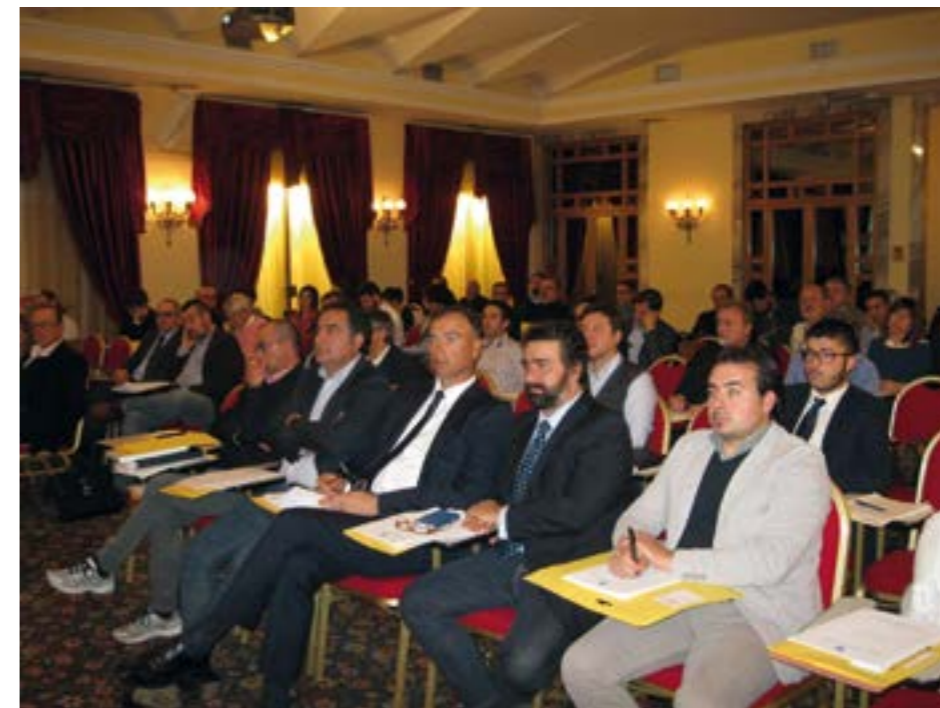
Uno scorcio della "Sala Risorgimento" dove si è svolta la riunione, gremita di Presidenti dei Collegi territoriali degli Agrotecnici e degli Agrotecnici laureati.

Grande interesse del parterre anche per la questione PAN, che resta al momento un nodo spinoso per gli iscritti negli Albi.