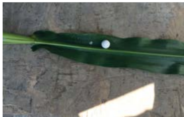
A sinistra uova di Piralide e a destra capsula di cellulosa contenente le uova di Tricogramma

MS - È normale incontrare difficoltà, soprattutto nel nostro caso, visto che si trattava di un lavoro innovativo. Le complicazioni sono state numerose, anche in virtù del fatto che non abbiamo eseguito delle semplici prove o dimostrazioni, ma abbiamo sviluppato un piano di lavoro su grandi superfici: in 45 giorni sono state effettuate 132 ore di volo del drone che ha trattato più di 830 ettari di terreno. Non vanno dimenticate neppure le difficoltà burocratiche relative alle autorizzazioni per fare volare il drone e, inizialmente, anche qualche contrattempo tecnico, con il distributore delle capsule che siamo riusciti a superare grazie alla professionalità del pilota, competente e disponibile. Va inoltre sottolineato che l'organizzazione di una squadra composta da tre persone, del materiale occorrente per lavorare nel migliore dei modi ed in regola con le disposizioni legislative vigenti non è poca cosa. Anche la programmazione giornaliera dei trattamenti non va sottovalutata, oltre ad essere regolari, devono seguire una logica di efficienza, tuttavia, il lavoro più impegnativo è stato l'elaborazione delle strategie