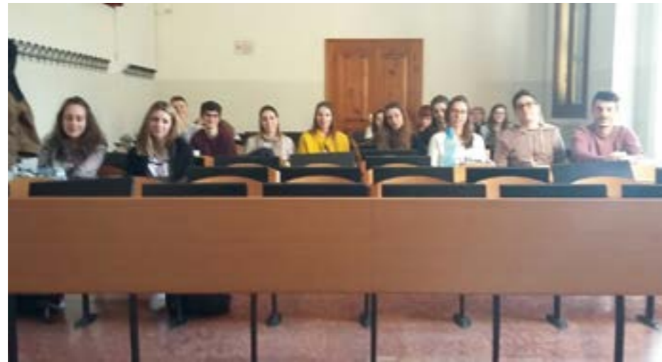
I ragazzi assistono interessati.