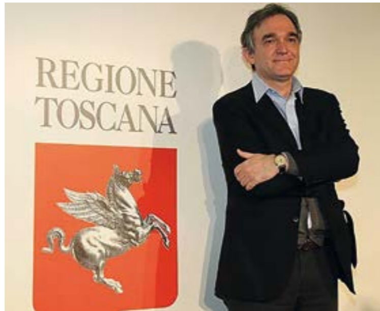
Il Governatore della Toscana Enrico Rossi